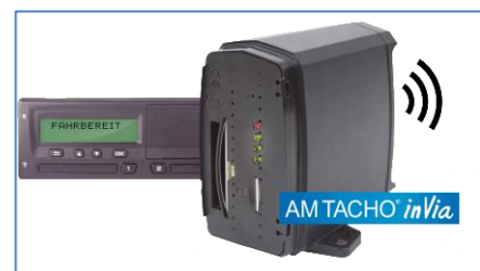
Abbildung - AM TACHO inVia Box

Um den Ausleseprozess und die damit verbundenen Standzeiten möglichst klein zu halten, bietet die AUTO METER AG ab sofort das AM TACHO inVia System an. Mit diesem System ist es möglich, Daten aus dem digitalen Fahrtenschreiber vom Büro aus auszulesen und zu übermitteln. Automatisch oder per Computer-Knopfdruck wird eine Ausleseaufforderung per Mobilnetz an die im Fahrzeug eingebaute AM TACHO inVia -Box versandt. Die Auslesung findet anschliessend vollständig autonom zwischen dem Fahrtenschreiber und der inVia -Box statt. Die ausgelesenen Daten werden im Anschluss an den Benutzer fernübermittelt.