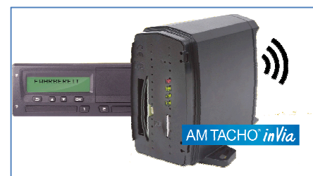
Abbildung - AM TACHO inVia Box

Um den Ausleseprozess und die damit verbundenen Standzeiten möglichst klein zu halten, bietet die AUTO METER AG ab sofort das AM TACHO inVia System an. Mit diesem System ist es möglich, Daten aus dem digitalen Fahrtschreiber vom Büro aus auszulesen und zu übermitteln. Automatisch oder per Computer-Knopfdruck wird eine Ausleseaufforderung per Mobilnetz an die im Fahrzeug eingebaute AM TACHO inVia -Box versandt. Die Auslesung findet anschliessend vollständig autonom zwischen dem Fahrtschreiber und der inVia -Box statt. Die ausgelesenen Daten werden im Anschluss an den Benutzer fernübermittelt.